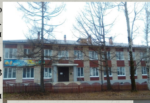
Детская школа искусств