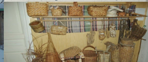
Центр народного творчества и туризма «Горница»