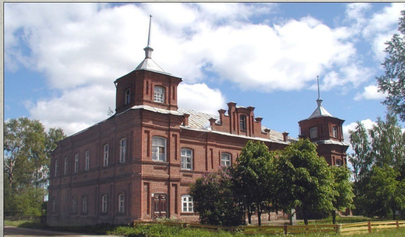
Кологривский краеведческий музей им. Г.А.Ладыженского

Краеведческий музей им. Г.А. Ладыженского, г.Кологрив, ул.Некрасова.44 (посещение музея: экспозиции истории и природы местного края; коллекции художественных произведений: западноевропейская и русская живопись XVI –XX веков; творчество Е.В.Честнякова; «король акварели», основатель кологривского музея Г.А.Ладыженский. Коллекции оружия, предметов старины, этнографии, ценных и редких книг)