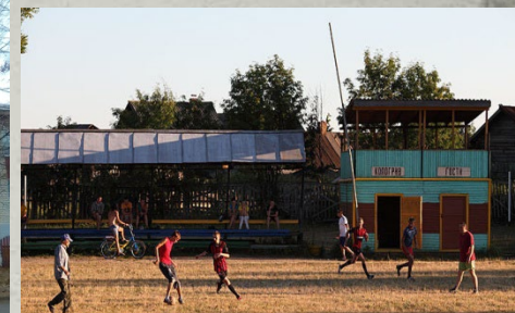
Зданий культурно-досугового типа - 13